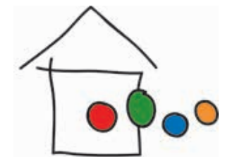
Katholisches Familienzentrum «St. Martinus» im Kreuz-Köln-Nord