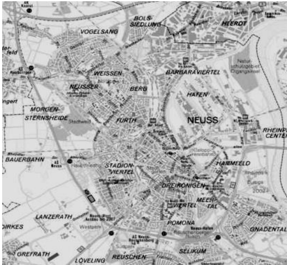
Planungsbezirke Stadt Neuss

Ein Teil unserer Kindertageseinrichtungen liegt sehr zentral in der Stadtmitte (Maria Goretti, St. Quirin, Hafenspatzen). Die anderen Einrichtungen liegen in umliegenden Stadtteilen Dreikönigenviertel (Hl. Dreikönige), Barbaraviertel (Sonnenschein), Stadionviertel (St. Pius), Neusser Furth (Arche Noah) und zählen zur erweiterten Innenstadt.