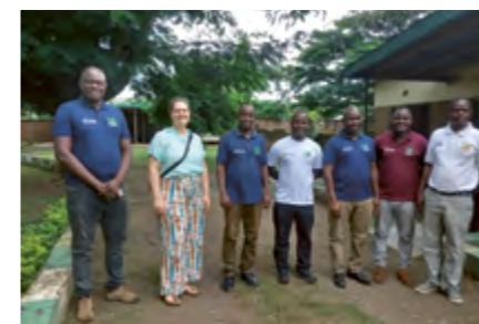
Treffen mit dem Lusubilo Community Care Management Team.