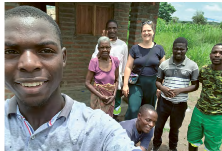
Besuch des Agogo-Projekts für ältere Menschen in der Pfarrei Benga.