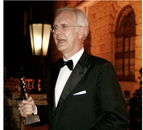
Harald Schmidt bei der Gala zur Verleihung des Fernsehpreises Romy in der Hofburg in Wien, Photo: Manfred Werner, CC BY-SA, unter: https://upload.wikimedia.org/wikipedia/commons/4/47/ROMY2011_b04_Harald_Schmidt.jpg .

Aus: https://www.katholisch.de/artikel/33006-kirchenaustritt-fuer-harald-schmidt-unvorstellbar vom 3. Februar 2022 [letzter Zugriff am 9. Februar 2022], gekürzt.