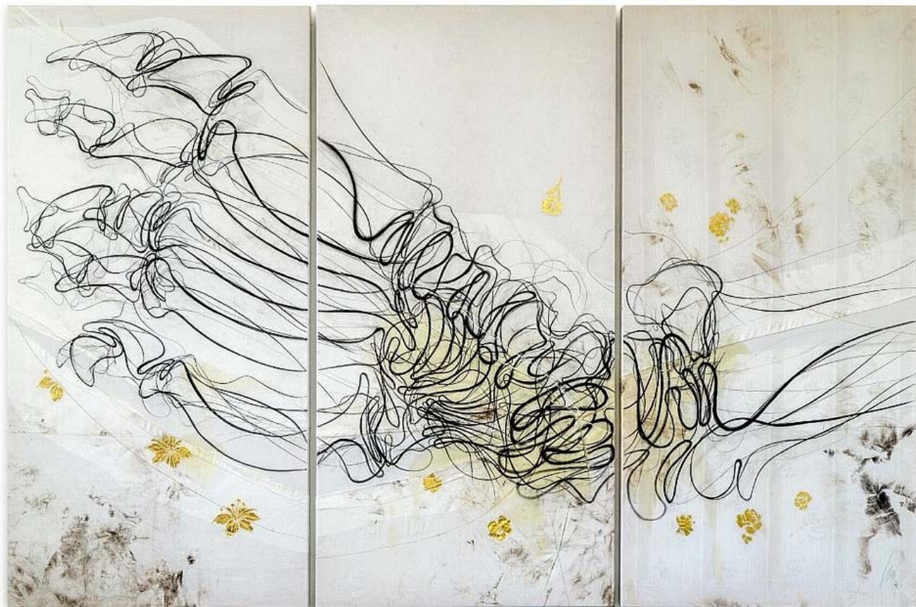
Das MISEREOR-Hungertuch 2021 „Du stellst meine Füße auf weiten Raum“ von Lilian Moreno Sánchez