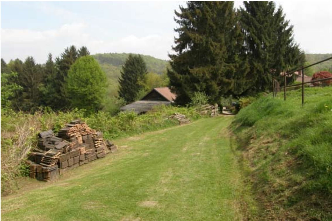
14.) nach Waldstück Betreten des Gehöfts „Jungholz“; am Anfang schöner Wiesenplatz zum Rasten