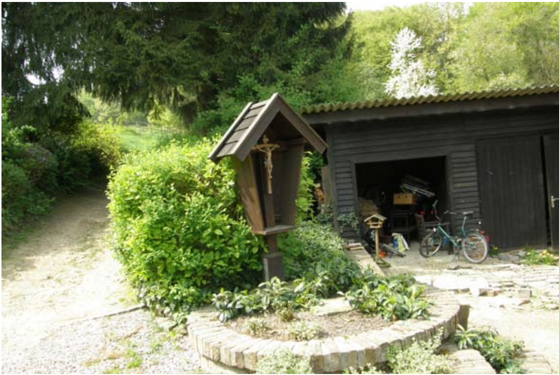
15.) auf dem Gehöft ein Kreuz