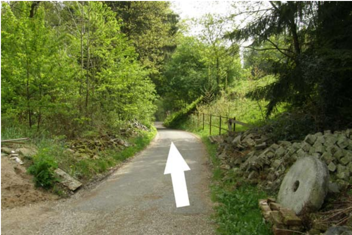
16.) Gehöft auf Asphaltweg wieder verlassen