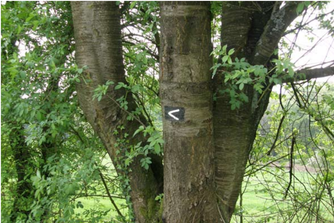
12.) Feldweg = Weg „<“