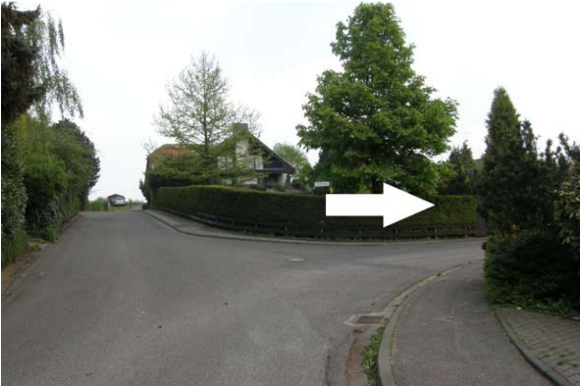
10.) an zweiter Einmündung (in Linkskurve) rechts