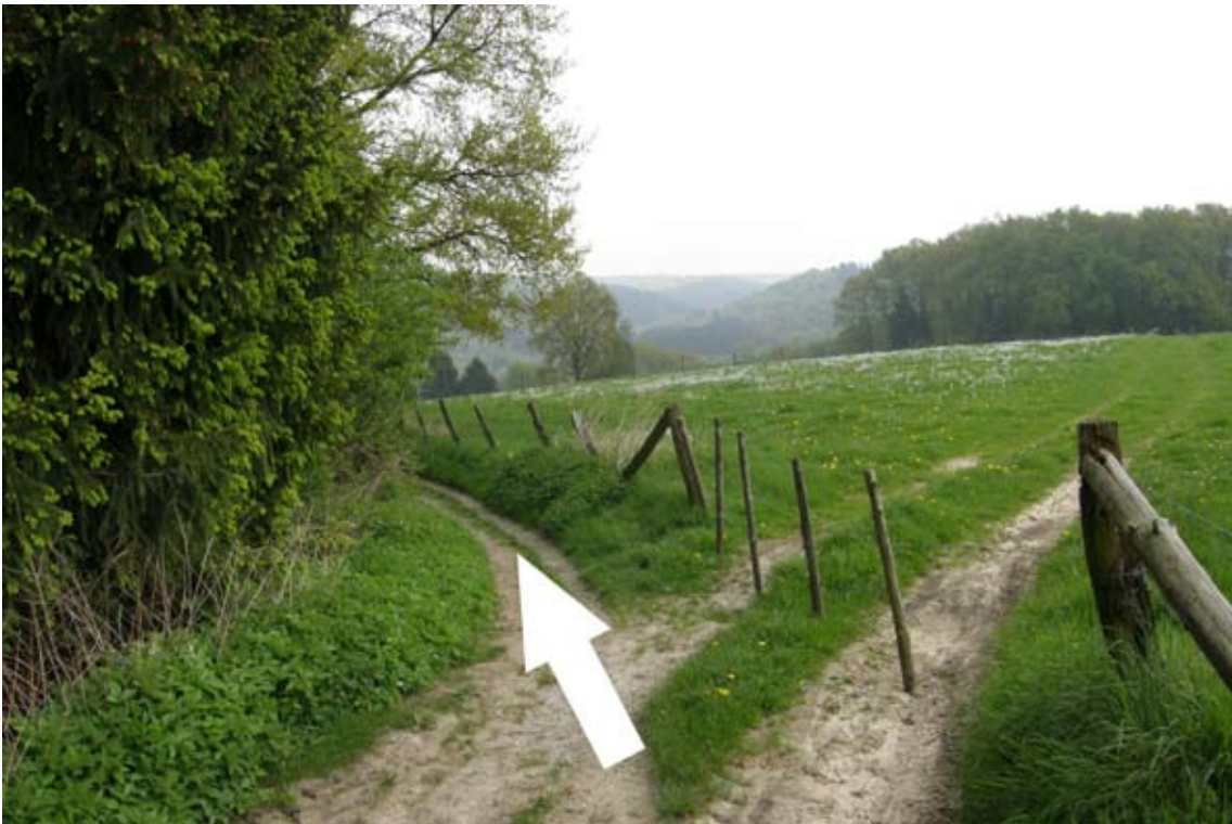
13.) Feldweg führt an Koppel halb links in den Wald hinein und wird stellenweise sehr schmal