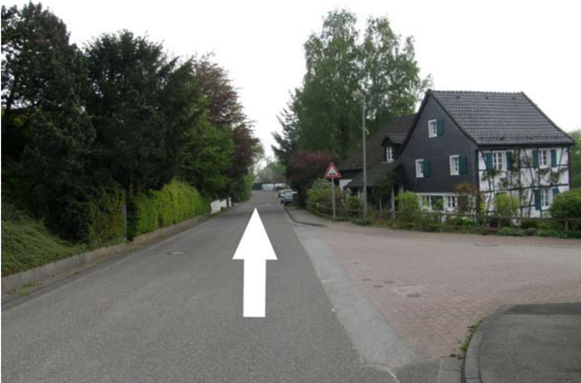
9.) an der ersten Rechtseinmündung weiter geradeaus