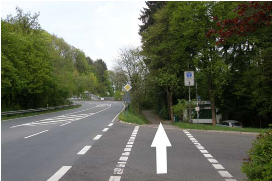
22.) am Kiosk vorbei zum Dom