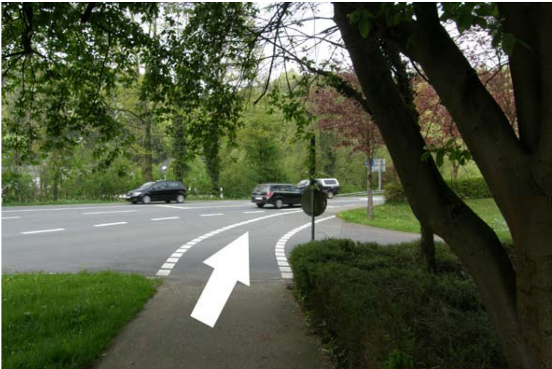
21.) dem Rad- und Fußweg folgen