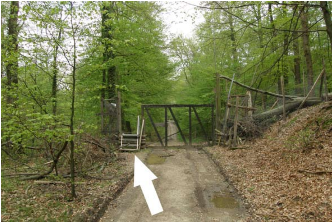
17.) den Park wieder über die Treppe verlassen