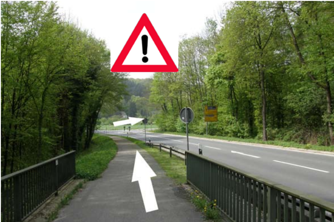
20.) an der Einmündung über die Verkehrsinsel die Straße überqueren