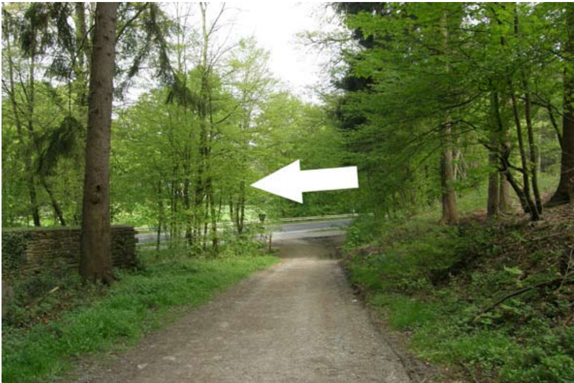
19.) an der Straße links auf Rad- und Fußweg