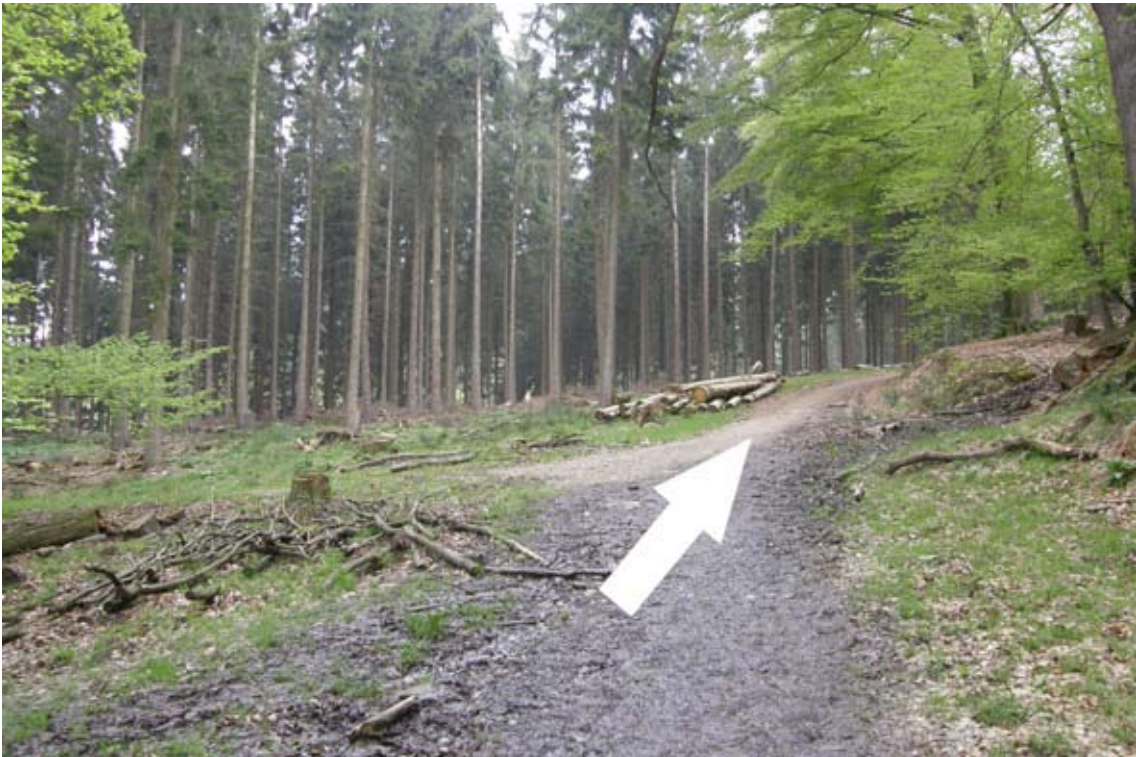
14.) nach kurzem Anstieg geradeaus