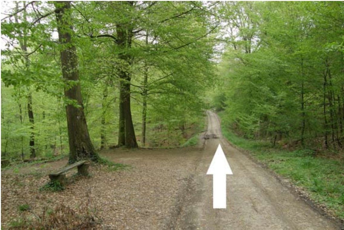
18.) hinter Treppe geradeaus