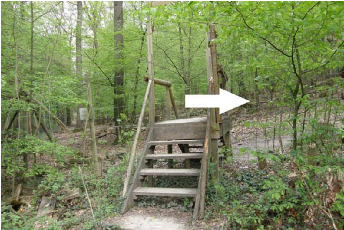
13.) am Ende den Wildpark über die Treppe betreten