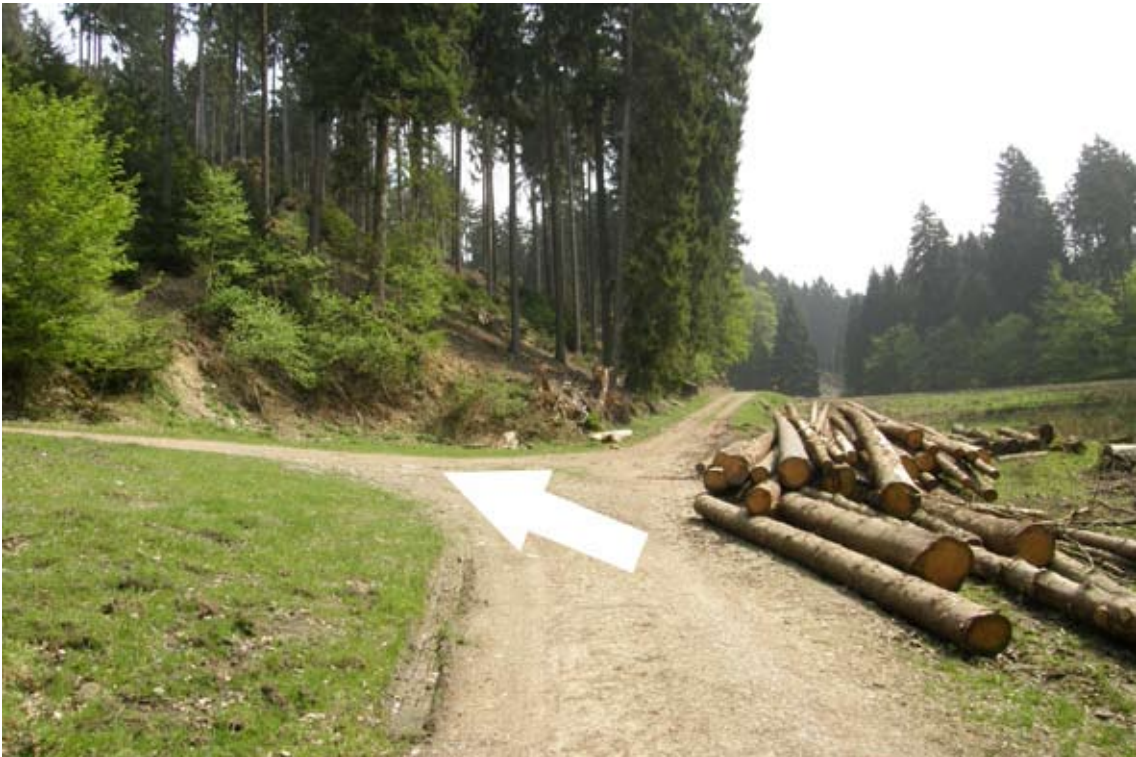
16.) an Gabelung auf großer Lichtung links