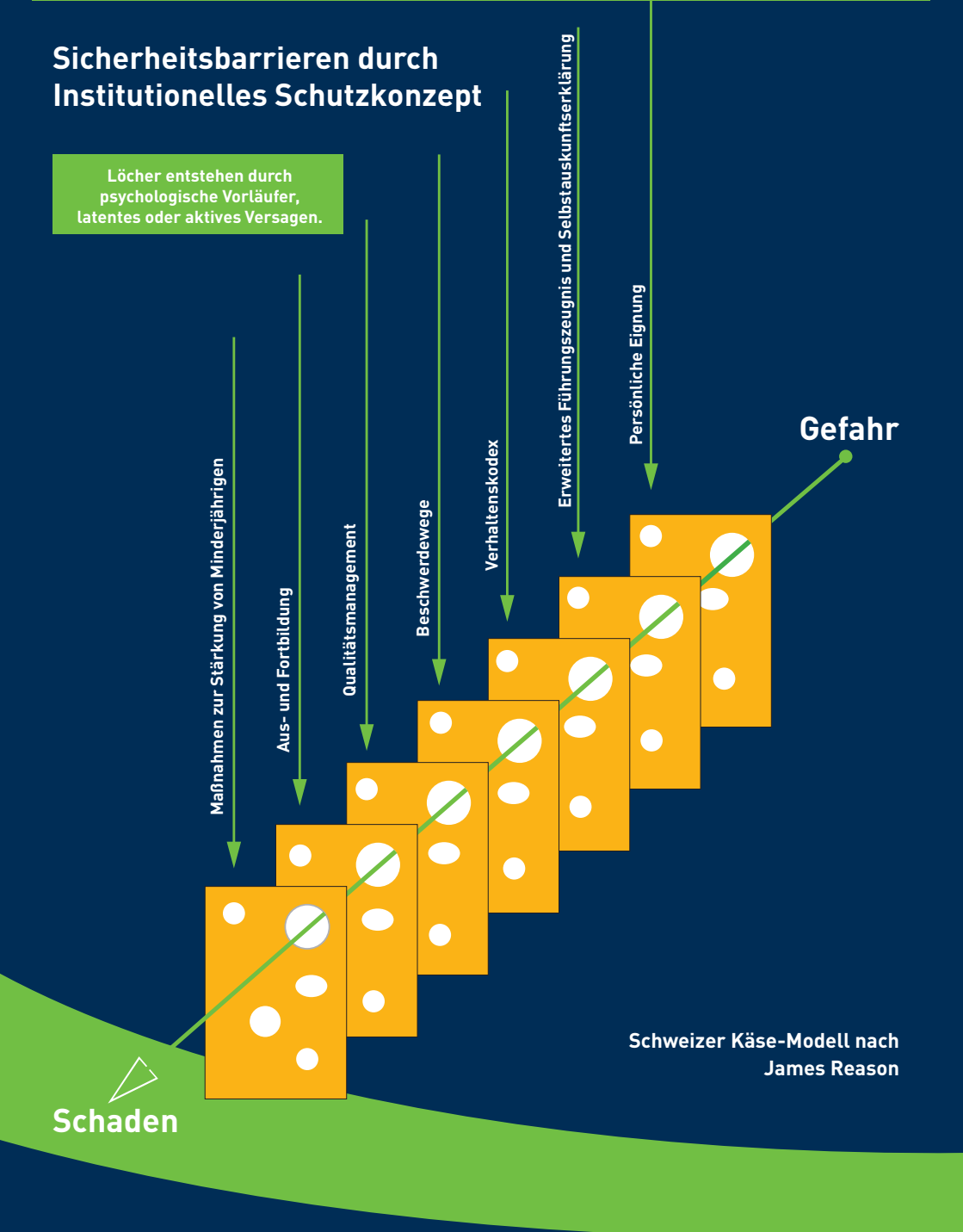
Schweizer Käse-Modell nach James Reason

Löcher entstehen durch psychologische Vorläufer, latentes oder aktives Versagen.