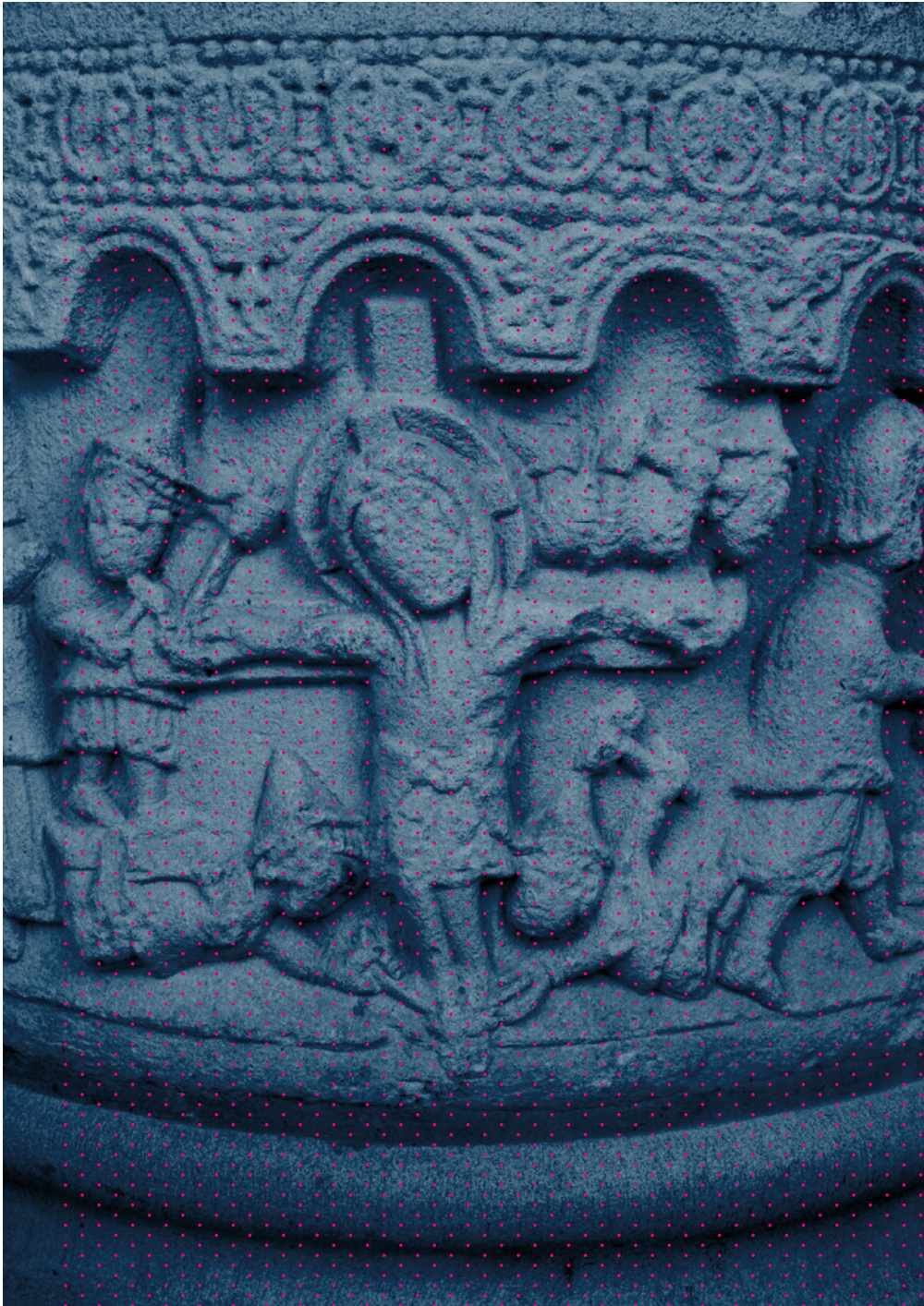
Abb. 5 – Dortmund-Aplerbeck, Georgskirche, Taufstein (Ende 12. Jh.) mit Darstellung der Kreuzigung Christi durch Juden