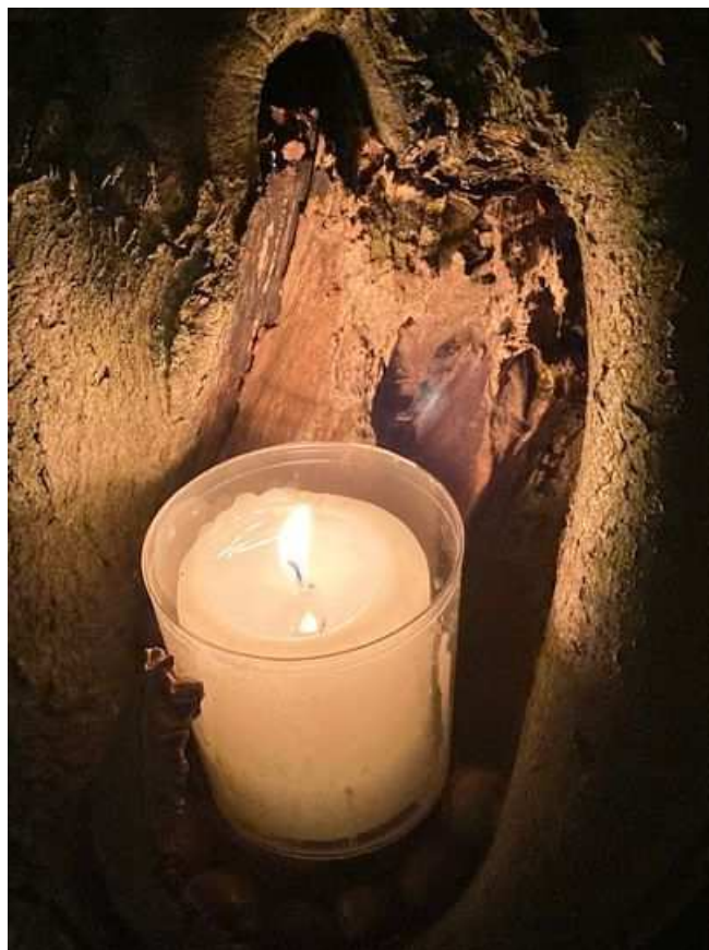
Abteipark Brauweiler