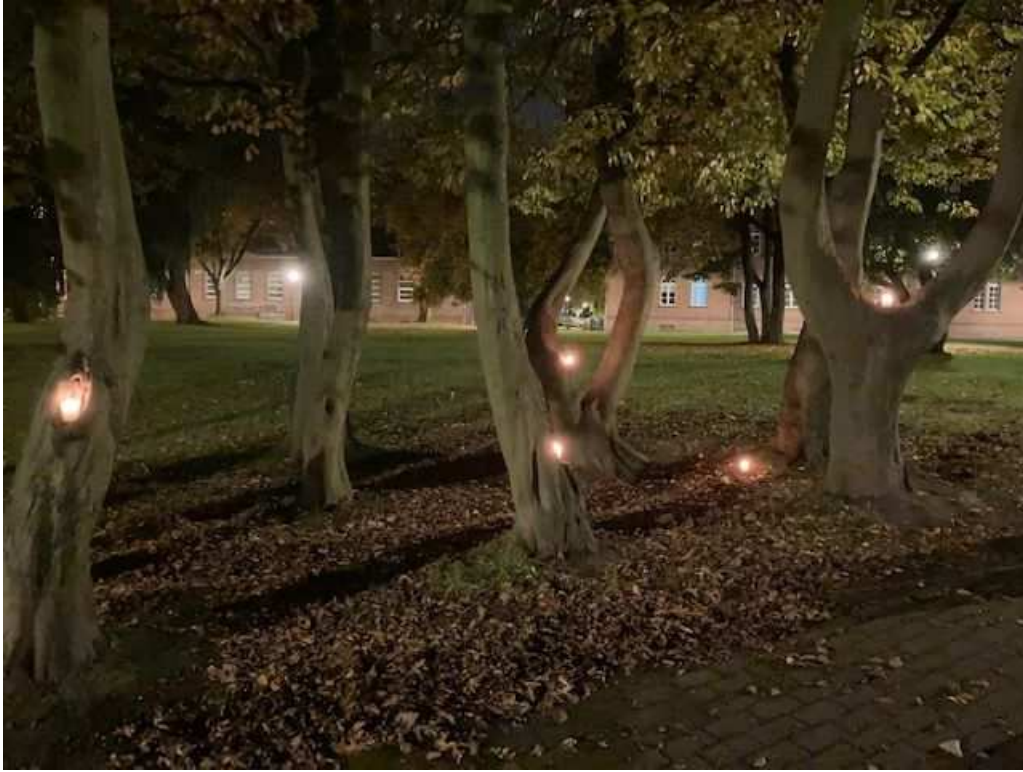
Abteipark Brauweiler | Foto: Agnes Laurs 2020