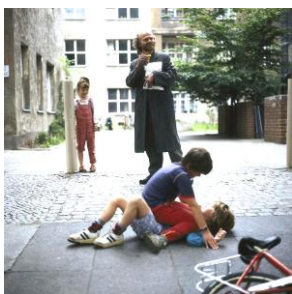
Der liebe Gott im Schrank

Spiel- und Dokumentarfilme - Bilderbuchkinos - Dias Religionspädagogische Arbeitsmaterialien