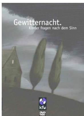
Gewitternacht/Die große Frage