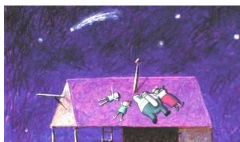
Das Geheimnis der Frösche