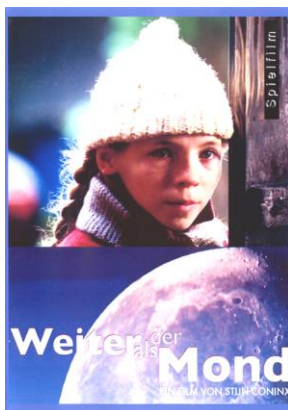
Weiter als der Mond Spielfilm

Medientipps zu Welterklärung / Vernunft / Schöpfung