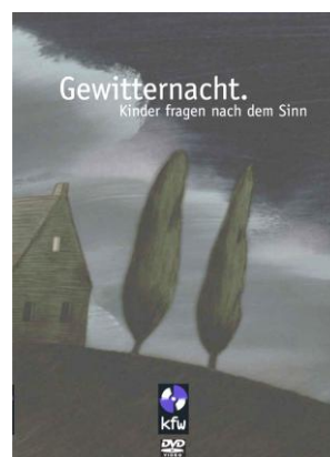
Gewitternacht / Die große Frage 2 Kurz-Animationsfilme