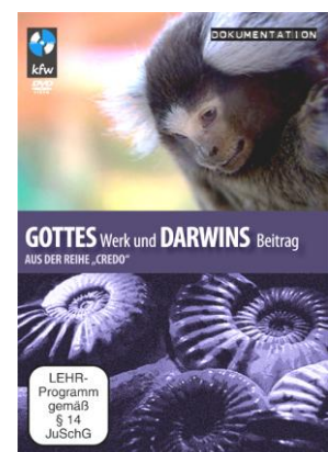
Gottes Werk und Darwins Beitrag Dokumentarfilm